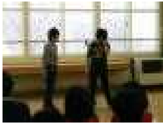
【名コンビの漫才（5年生）】