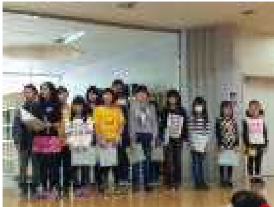
【開会式でお店紹介をする代表者たち】

児童数の減少などから、年々企画をするのも難しくなっています。保護者や地域の方々と交流を持つ絶好の機会としても、企画や内容をさらに検討していきたいと思います。