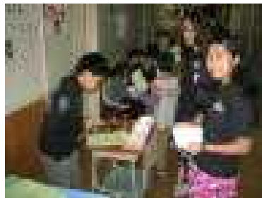
【大繁盛のお化け屋敷受付（3年生）】