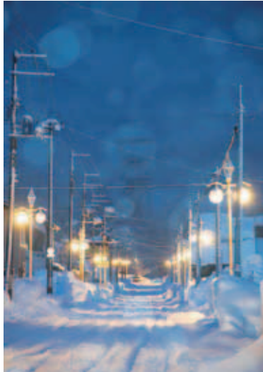
「雪の炭鉱街」 Coal mine explorerさん