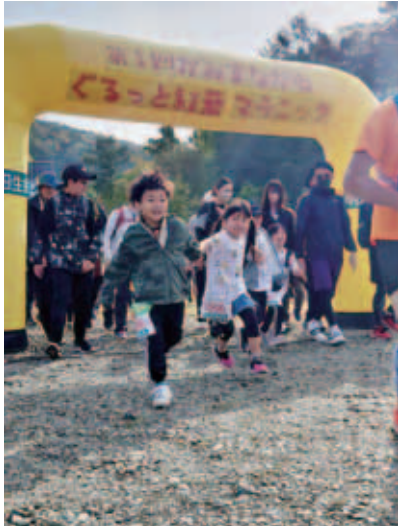
「頑張っていくぞー！」 m.kさん