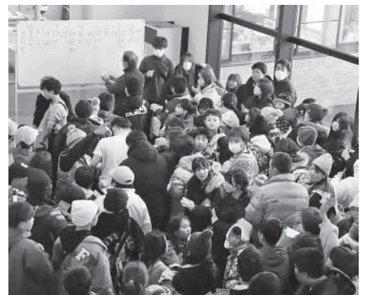
産業活性化センターを埋め尽くすビンゴ大会のにぎわい。