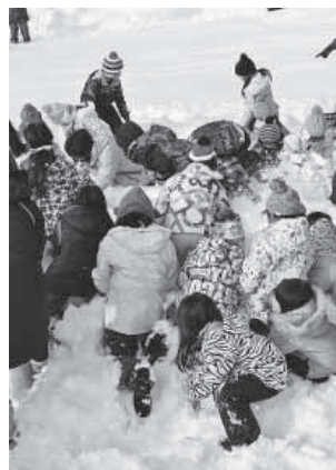
雪を掘って宝探し!