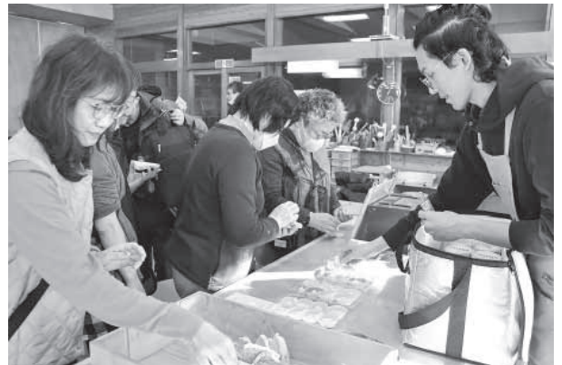
きまぐれパン工房のウォッシュチーズとカンパーニュの試食を楽しむ参加者の皆さん。