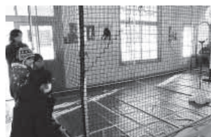
滑り台で駆け抜ける!(写真上) ドローンサッカーの様子。(写真下)