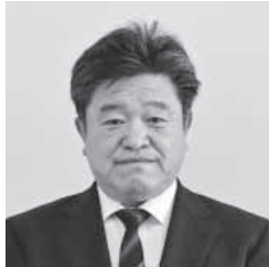
くらね たかのり 藏根 高史(65) 立憲民主党・現・2回