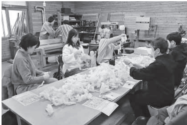
アロマボール製作の様子。ヒノキから削り出した削り華を巻きつけています。