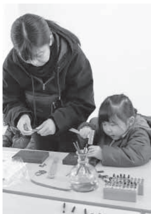
親子で本革キーホルダー製作に挑戦。