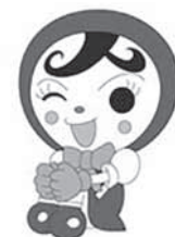
人権イメージキャラクター 人KENあゆみちゃん