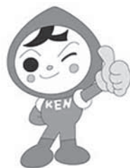
人権イメージキャラクター 人KENまもる君