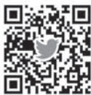
公式アカウント ユーザー名: kasumin2023

今後は協会の情報を、会員皆さまをはじめ、町民や道民の皆さまにも発信して参りますので、よろしくお願いたします。